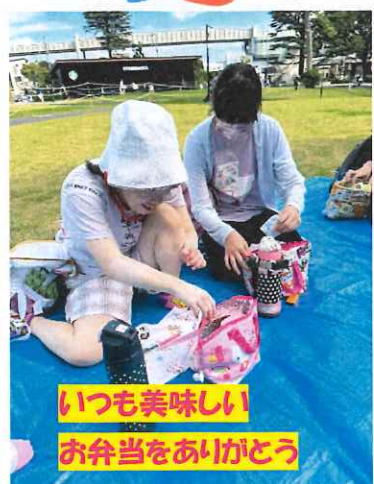
いつも美味しい お弁当をありがとう