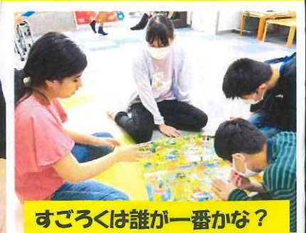
すぐろくは誰が一番かな?