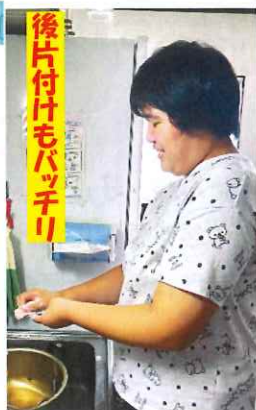
後片付けもパツチリ