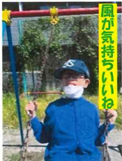
風が気持ちいいね