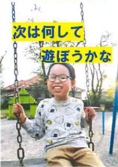
次は何して 遊ぼうかな