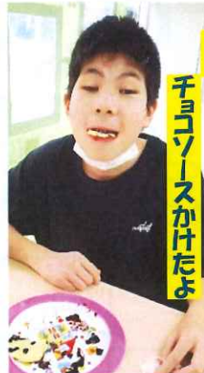
チョコソースかけたよ