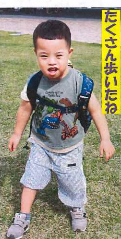
たくさん歩いたね